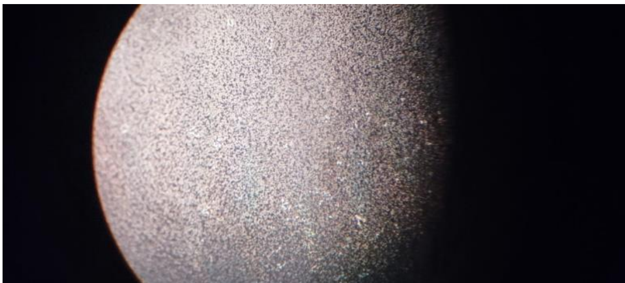
Рисунок 2. Покрытие из PVDF